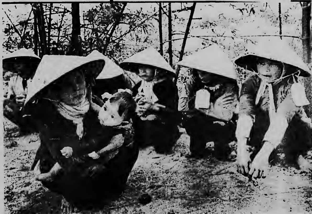
Habitantenan di e pueblo na Sur Vietnam, algun cu un kaarchi na nan sombré pegá, ta sperando pa nan ser interrogá pasobra ora tropanan mericano a invadi e pueblo, nan a hanja indicacion cu e hendenan aki tabata colabora cu Viet Cong.